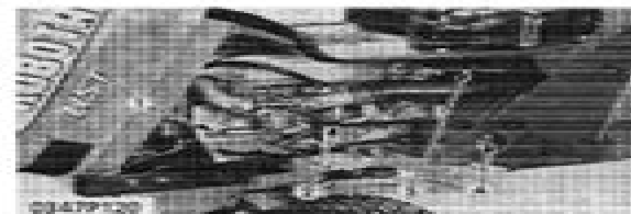
(6) 1P Connector